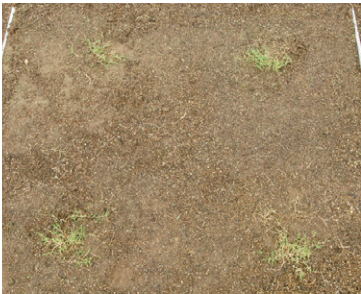
1平方メートルあたり4株植えつけ