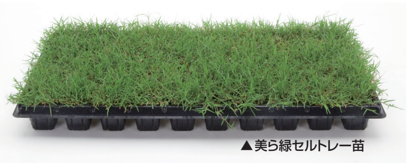
▲美ら緑セルトレー苗