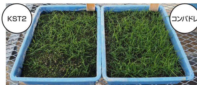
(くにさだ育種農場ハウス内試験 播種2か月後)

発芽初期生育が早い品種であり、発芽促進処理を行っているため発芽、初期生育が早いです。生育が緩慢なため、省力管理が可能です。耐暑性、耐乾燥性、耐踏圧性に極めて強く、粗放管理が可能です。