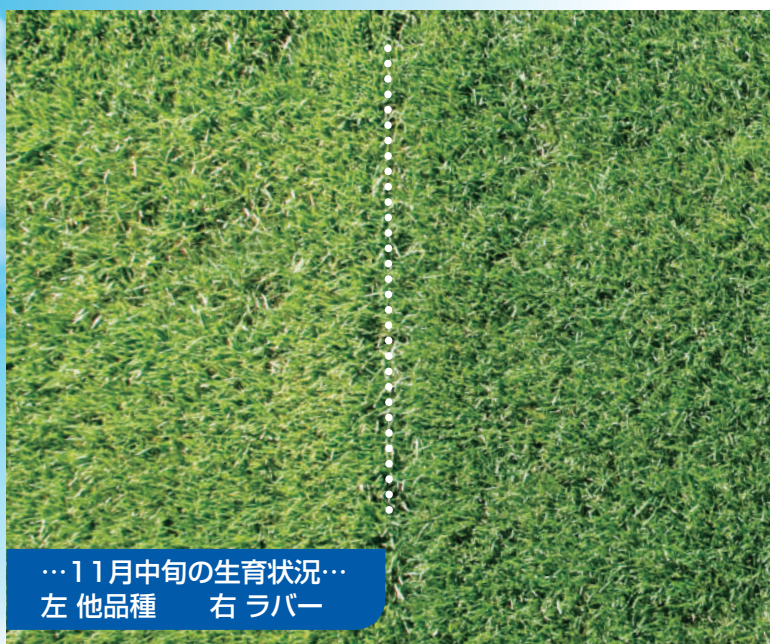
…11月中旬の生育状況… 左 他品種 右 ラバー