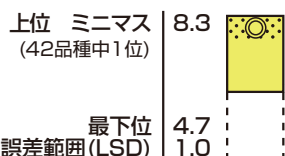
2014 リーフスポット耐病性