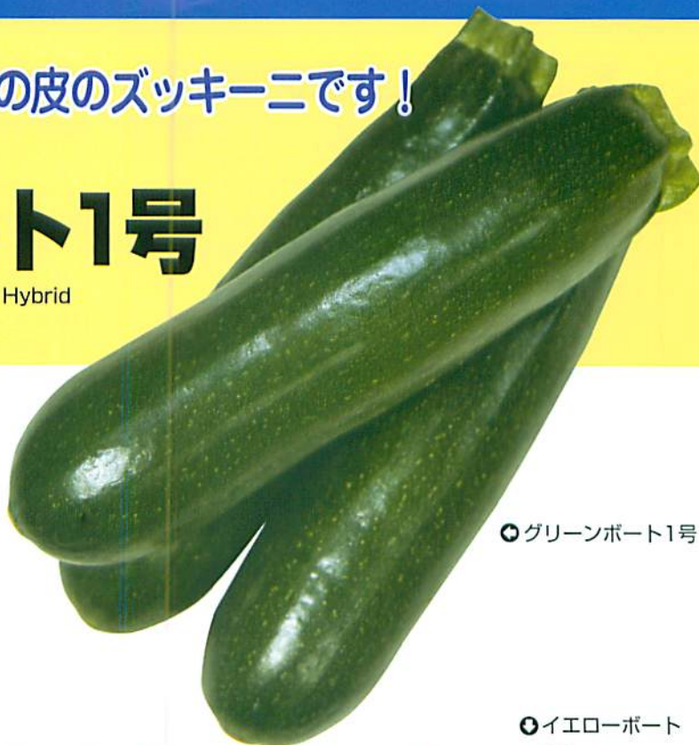
◎グリーンボート1号