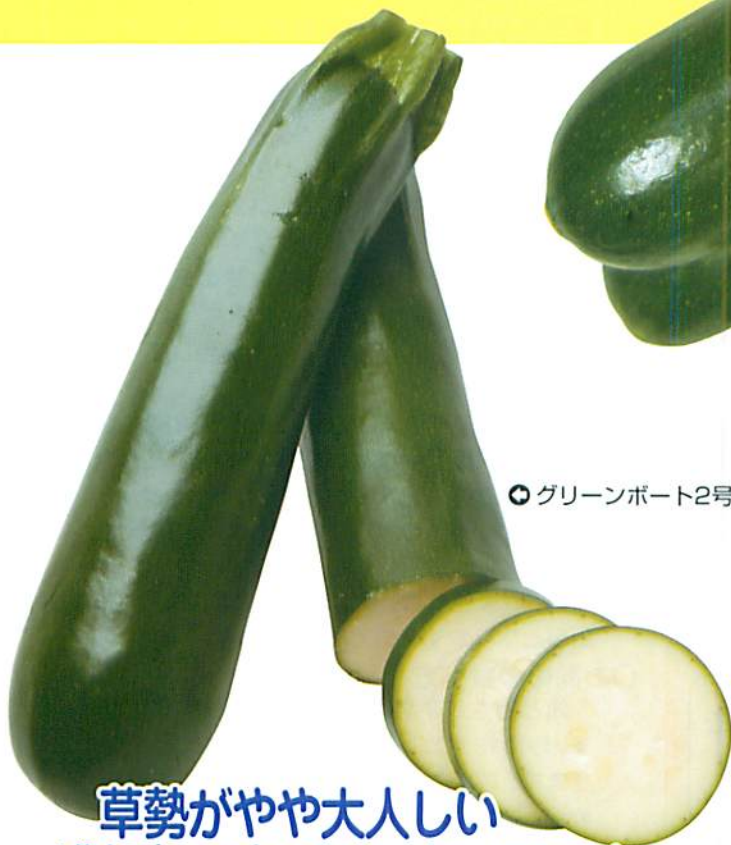
◎グリーンボート2号