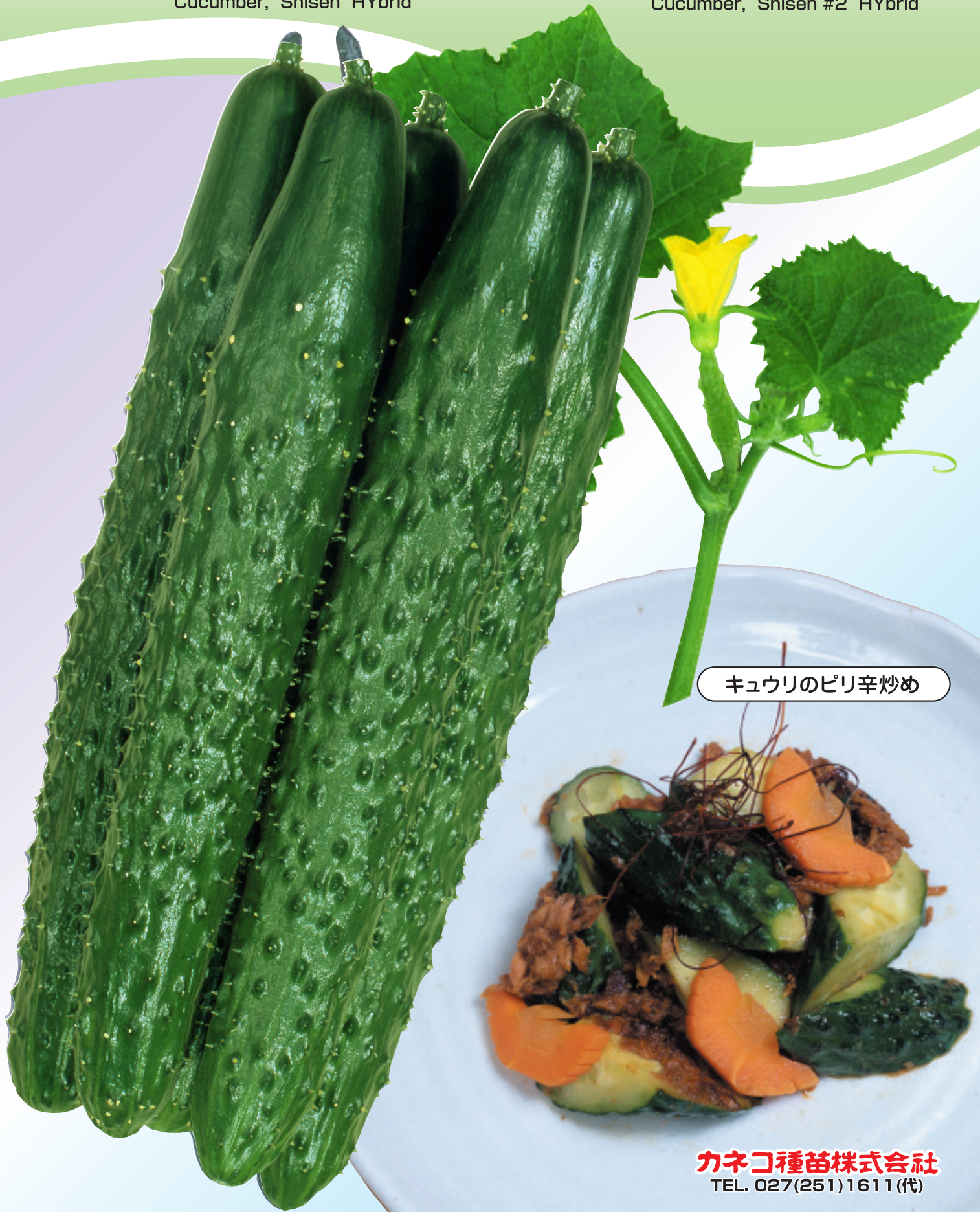
キュウリのピリ辛炒め

(カネコ交配) キュウリ し せん 四川2号 Cucumber, Shisen #2 HYbrid